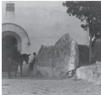
Figura 4. En aquesta fotografia es pot apreciar com a principis del segle XX hi havia un arbre dins l’espai que queda entre les lloses gegants.

Citació en el text del treball: “... en una fotografia anònima de principis de segle es veu com l’arbre havia crescut al mig de les pedres del dolmen (vegeu figura 4).”