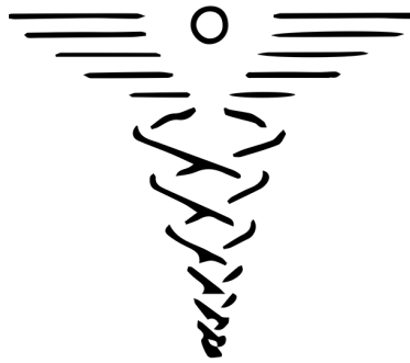
Figura 5. El caduceu és un dels símbols del comerç. Extret de "Caduceus simple" de CFCF, Wikimedia Commons. https://commons.wikimedia.org/wiki/File:Caduceus_simple.svg . Llicència CC-BY-SA-3.0.

S'ha de posar la nota al peu de la figura en un cos de lletra més petit.